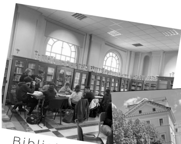
Biblioteca (piano terra palazzina B)